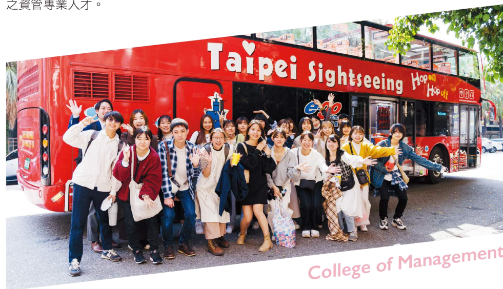
College of Management

本所以「AI科技」以及「數據分析」為基礎，「創新」及「商業」為專長領域之教學特色。課程理論與實務並重，培養具產業數位轉型與跨域整合之數位科技創新與經營決策人才。