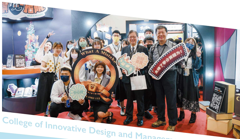
College of Innovative Design and Management